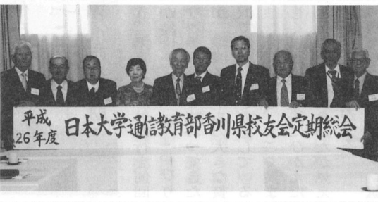
平成26年度 日本大学通信教育部香川県支部総会

平成26年度香川県支部総会では、支部長の挨拶の後、平成25年度の行事・収支の報告と平成26年度行事計画(案)・予算(案)が提示され、原案のとおり承認されました。