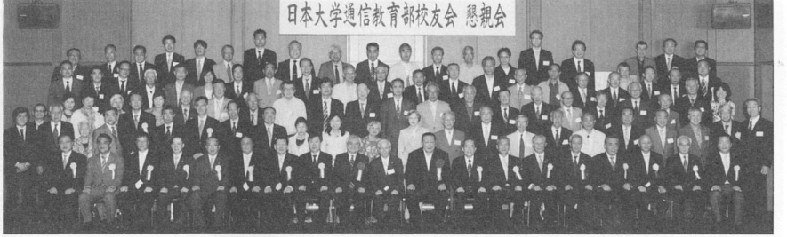
記念写真撮影後、懇親会に進んだ。