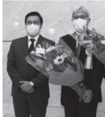
新旧の通信教育部長へ花束贈呈