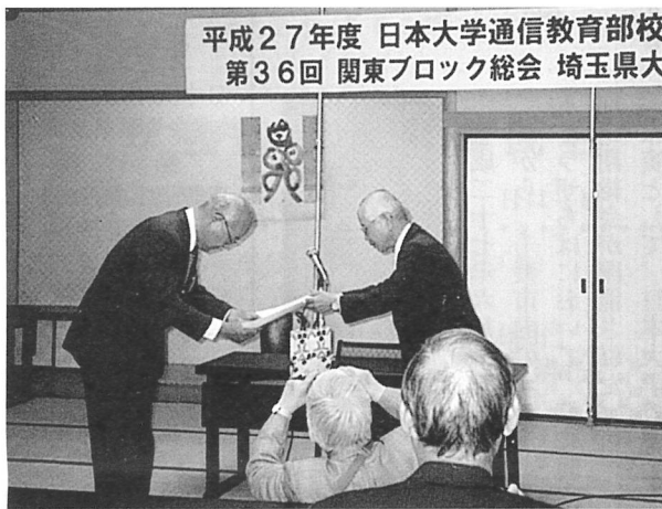
平成27年度 日本大学通信教育部校第36回 関東ブロック総会 埼玉県大

懇談会から、通信教育部在学中で参議院議員(埼玉県選挙区)の行田邦子氏が出席、挨拶の後懇親会が始まり、大いに盛り上がった。 4、観光 翌日は、さいたま市にある鉄道博物館を見学後、来年の再開を約し散会となった。 (文責 仲井博幸)