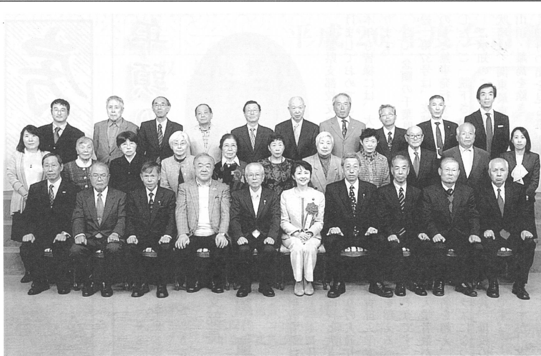
平成27年11月7日 日本大学通信教育部校友会 関東ブロック総会

次第は次の通りです。 1、総会(午後2時30分～午後4時) (1)校歌斉唱 (2)開会の言葉 (3)主催者挨拶 鎌子埼玉県支部長 金子関東ブロック長 (4)祝辞 白戸通信教育部校友会会長 (5)感謝状授与