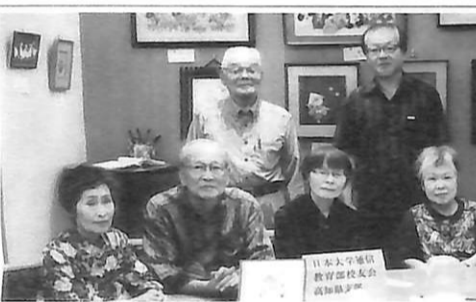
(文責 和田 明)

9月12日、支部総会を開きました。同日開催は4回目です。 決定したこと ①四国ブロック会出席者決定 ②5月総会15年ぶりに代表派遣