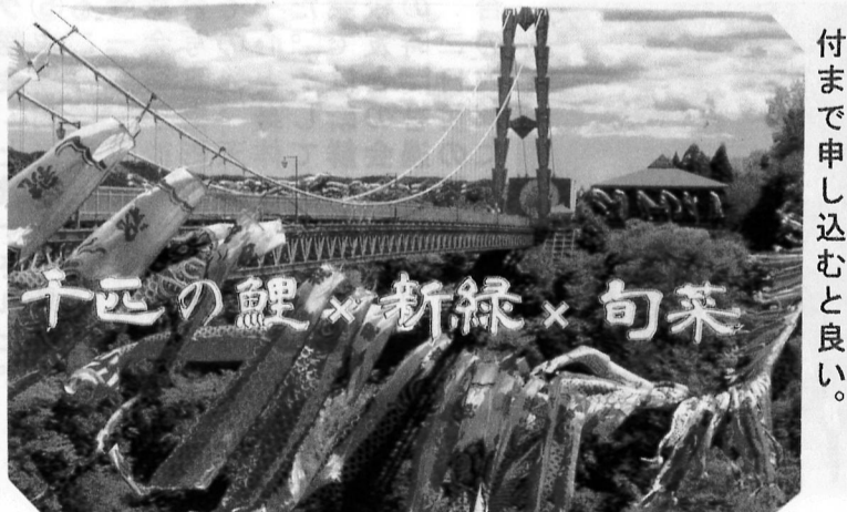
千匹の鯉×新緑×旬菜

秋の特別展示 鳴く虫 松虫の鳴く音を録音して、CDとして販売。松虫の鳴く音を録音して、CDとして販売。